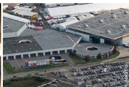
Le Centre Foire et Congrès, à La Grange aux Bois

Pour retrouver l'ensemble des sites : www.congres-metz.com