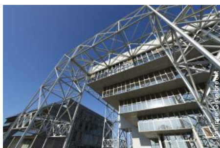
Le CESCO, au Technopôle de Metz