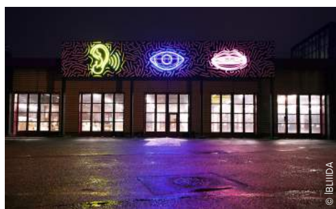
BLIIDA, à Metz