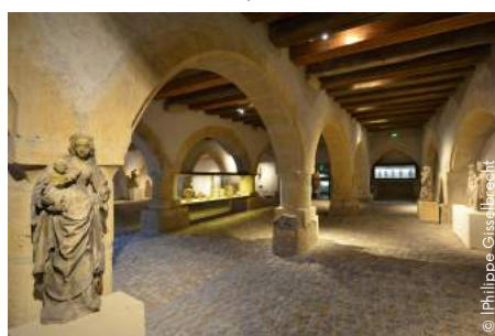
Le Grenier de Chèvremont, à Metz