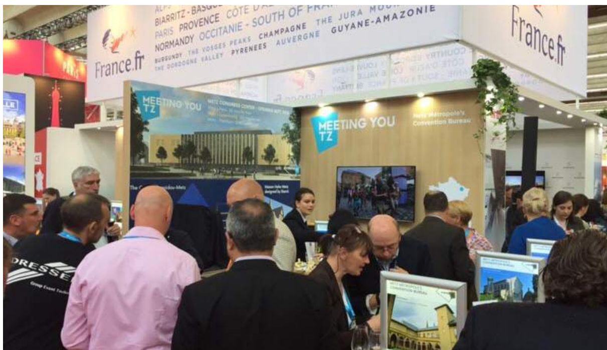
L'agence Inspire Metz à IMEX 2018

Grâce à ce travail, des premiers succès ont pu être engrangés tels que l'événement international ESWC. D'autres actions vont être prochainement réalisées comme par exemple la réalisation d'un film de promotion de la destination.