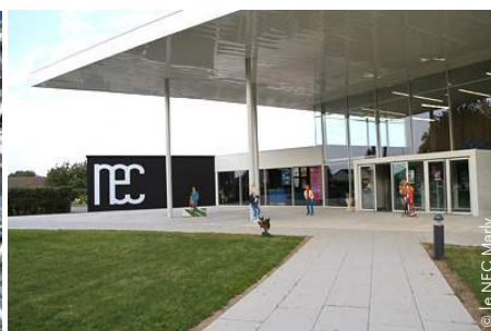
Le NEC, à Marly