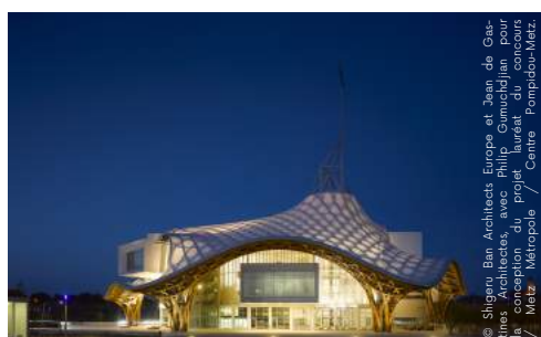
Le Centre Pompidou-Metz