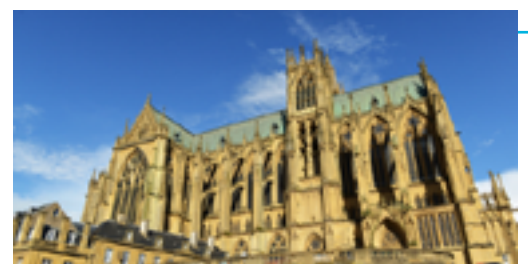
Cathédrale Saint-Etienne de Metz

Au niveau de la maison de l'éclusier, près du plan d'eau. Mais aussi à BLIIDA, le long de la Moselle, avec la vue sur la cathédrale. Le jardin botanique aussi !