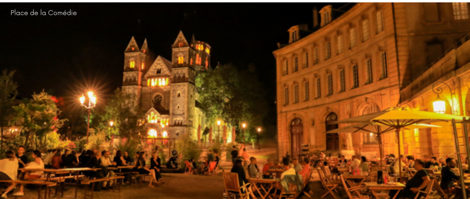
Place de la Comédie