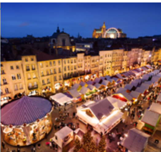
Marchés de Noël de Metz, place Saint-Louis