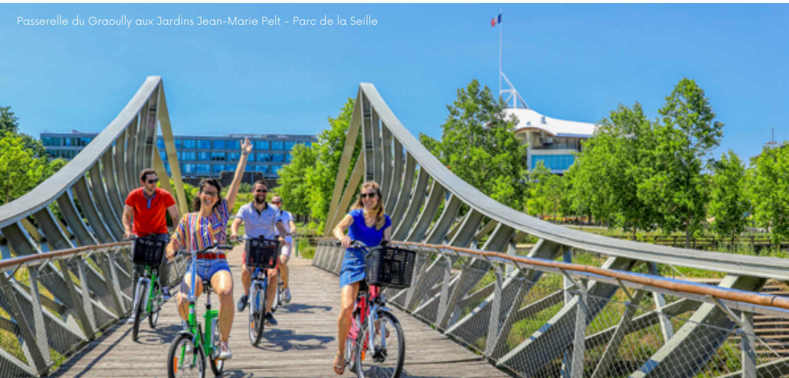
Passerelle du Graouilly aux Jardins Jean-Marie Pelt – Parc de la Seille

Pour moi, le charme de Metz se résume dans le contraste entre le centre historique et le quartier impérial, entre l'une des plus vieilles églises et la plus belle gare de France. J'aime beaucoup les abords de la cathédrale et le marché couvert, mais mon endroit préféré reste le Centre Pompidou-Metz, pour son architecture merveilleuse et pour sa programmation ouverte à tous.